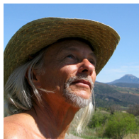
Francis Carnoy Photographe